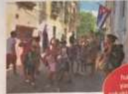
Küba halkını yekün yavutur ile anı sokaklarında karşılamak mümkün.