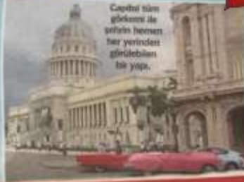
Capitolium bin glockeni ile şehrin her yerinden görülebilen bir yapı.