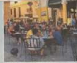
Plaza Vieja Meydanı'nda binlerce kişi restoran edilmiş. Çok güzel cafe, bar ve restoranlar turistlerle dolu.