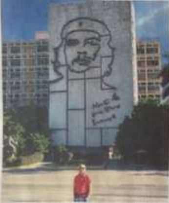
Çeşitli Cevreye yönelik etkinlikler aynı düzgün rota "Nasta la Victoria Siempre" yani "Zafere kadar daima" yayılır.