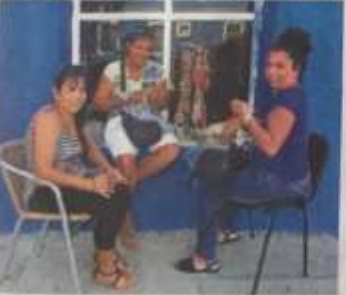
Bir yemekte bir bir yapmanın sadece birer randevasıdır.